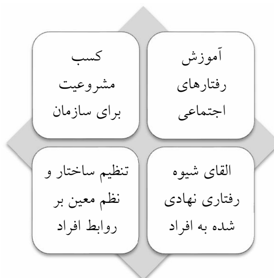
شکل ۱: کارکردهای اصلی نهادها (رشیدی راد ۱۳۹۰)